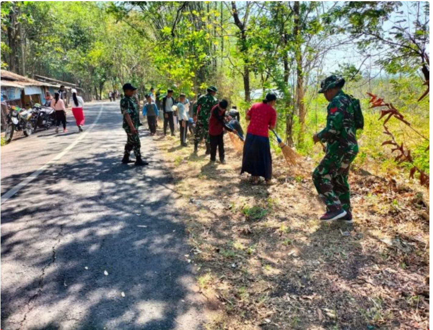
Jajaran Brigif 16 WY Bersama Warga Bersihkan Jalan dan saluran irigasi

KEDIRI - Brigif 16/Wira Yudha Kediri menggelar program Karya Bakti TNI Satnon Kowil semester II TA 2024, dengan sasaran pembersihan jalan dan irigasi (selokan). Karya Bakti juga sekaligus melakukan penyuluhan tentang Wawasan Kebangsaan yang bertempat di Kelularahan Sukorame, Mojohoto, Kota Kediri, pada Rabu (16/10/2024).